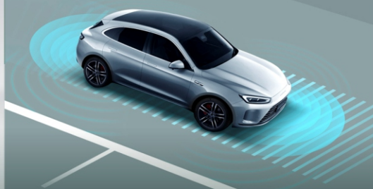
خودران سطح ۲ با سیزده دستیار کمک راننده