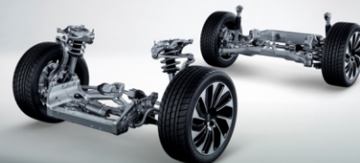
سیستم تعلیق جناقی دابل چهار اتصالی کمبر متغیر