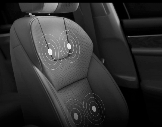
ماساژور پنج حالتی صندلی‌های جلو