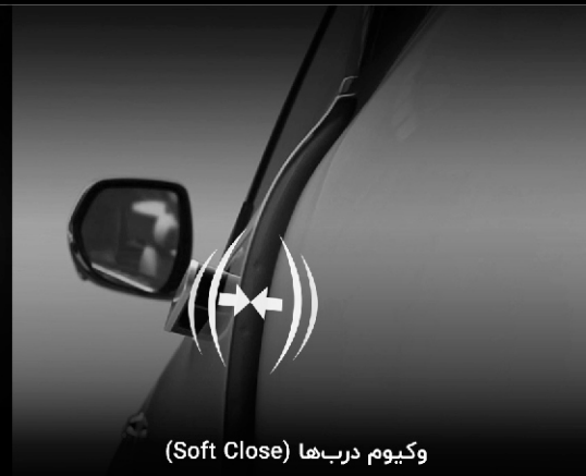
وکیوم دربها (Soft Close)